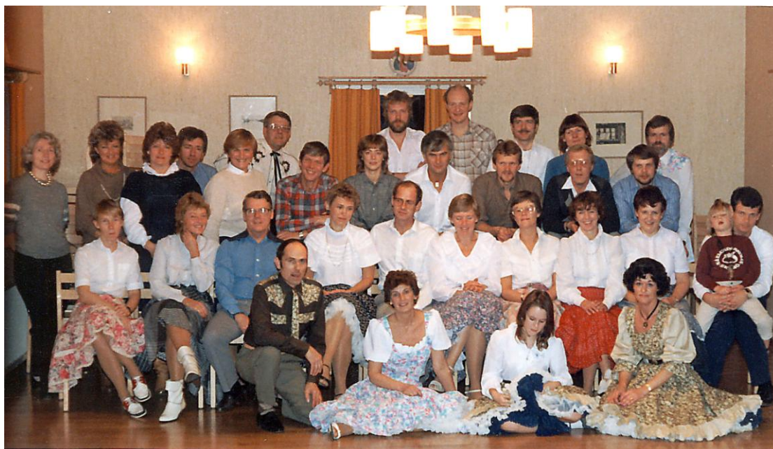
Dansare i Ekerö Hembygdsgård hösten 1983

Under hösten dansade klubben vid tre söndagar i Ekerö Hembygdsgård då vi bjöd in dansare från bl. a Solna och Sollentuna. Sista söndagen deltog även tisdagsgruppens nybörjare.