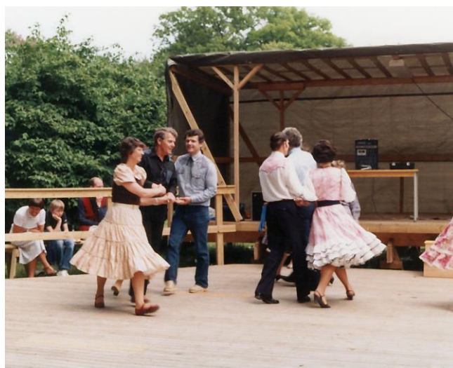
Uppvisning i Ekebyhovsparken 4:e juni 1983

Nästa stora evenemang i klubbens historia blev invigningen av Ekebyhovs slott den 10:e sept. 1983 då vi inför kungaparet i ihållande regn dansade två moderna danser- Foolhearted Memory och Louisiana Saturday Night samt en Oldtimer.