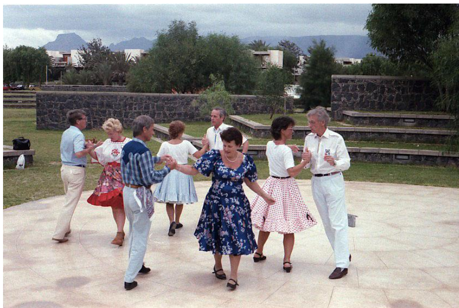
Första utlandsresans dansare på Ten Bel, Teneriffa.