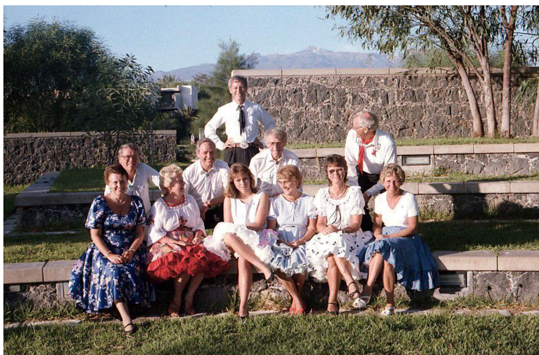
Ten Bel 1985