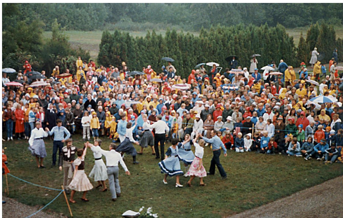
Uppvisning vid invigningen av Ekebyhovs slott

Nästa stora evenemang i klubbens historia blev invigningen av Ekebyhovs slott den 10:e sept. 1983 då vi inför kungaparet i ihållande regn dansade två moderna danser- Foolhearted Memory och Louisiana Saturday Night samt en Oldtimer.