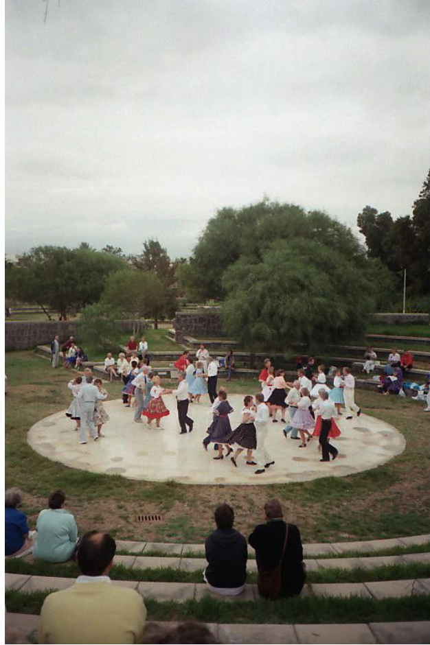
Ten Bel 1987