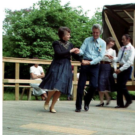
Uppvisning i Ekebyhovsparken 4 juni, 1983